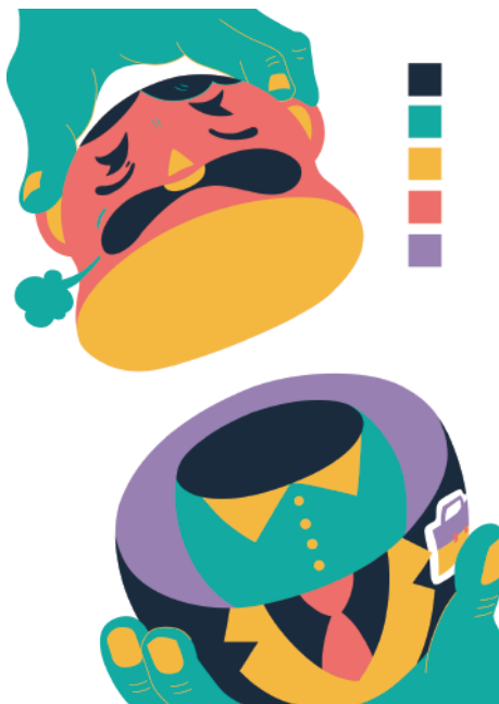
40% 莊彥芃 主要製作