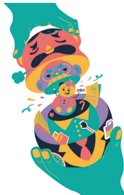
15% 李昱萱 細節、整合