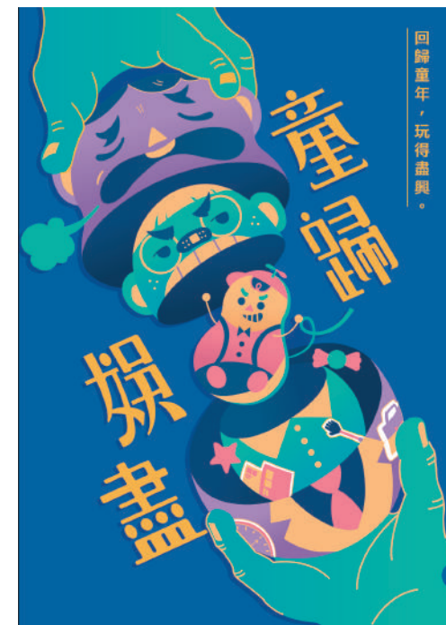
5% 蔡怡玟 標準字、色彩