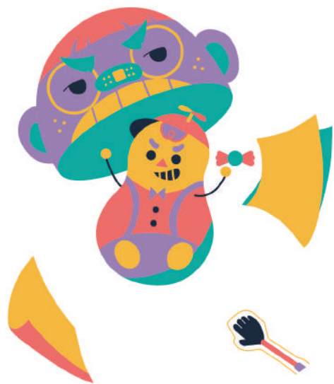
40% 簡秀瑛 主要製作